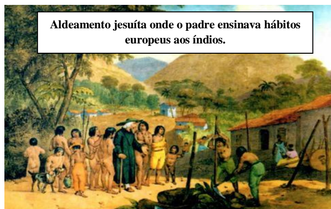
Aldeamento jesuíta onde o padre ensinava hábitos europeus aos índios.

Quando chegaram, os portugueses não ficaram tão entusiasmados com as novas terras, pois elas precisariam ser exploradas com calma e os interesses ainda refletiam sobre o comércio com o oriente. Somente alguns anos depois que Portugal começaria a se interessar pelo Brasil. Com o período de exploração da terra, colonos e religiosos europeus se estabeleceram no território, erguendo as primeiras construções.